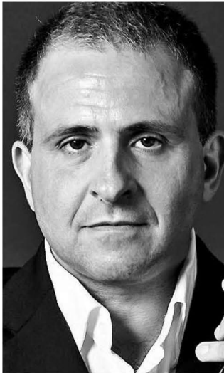
Domenico Nordio: Die Violinist spielt Werke von Brahms.